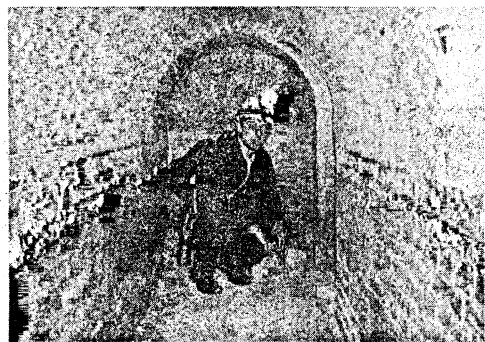
L'origine del forte di Pietole va ricercata in piena epoca napoleonica

L'opera voluta da Napoleone nel 1813 diventò una poveriera e nel 1917 fu quasi distrutta da un rogo